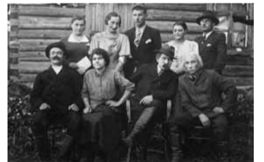
Latvijas katoļu jaunatnes biedrības Jezupovas nodaļas aktieru pulciņš.