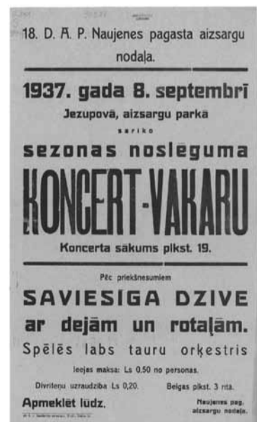
Naujenes pagasta aizsargu nodaļas koncertvakara afiša, 1937