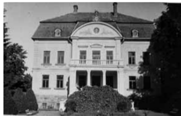
Juzefovas muiža 1935. gada 31. jūlijā

vāzes, pulksteņi un citi izcili mākslas darbi - piem. Salvatora Rosi [Salvator Rosa, 1615-1673] gleznas „Sv. Jēkabs no Kompostellas” kopija. Muižas otrajā stāvā atradās Baltais salons, iekārtots Ludviga XVI stilā. Mēbeļu komplektu jaunajai muižas ēkai izgatavoja Varšavas galdnieki pēc Lazenku pilī esošo mēbeļu parauga. Starp jaunajām mēbelēm atradās arī antikvāras, piemēram, sens tualetes galdiņš, apdarināts ar sudrabu un bronzu, kas kādreiz piederējis karaļa Jozefa Poņatovska mātei.