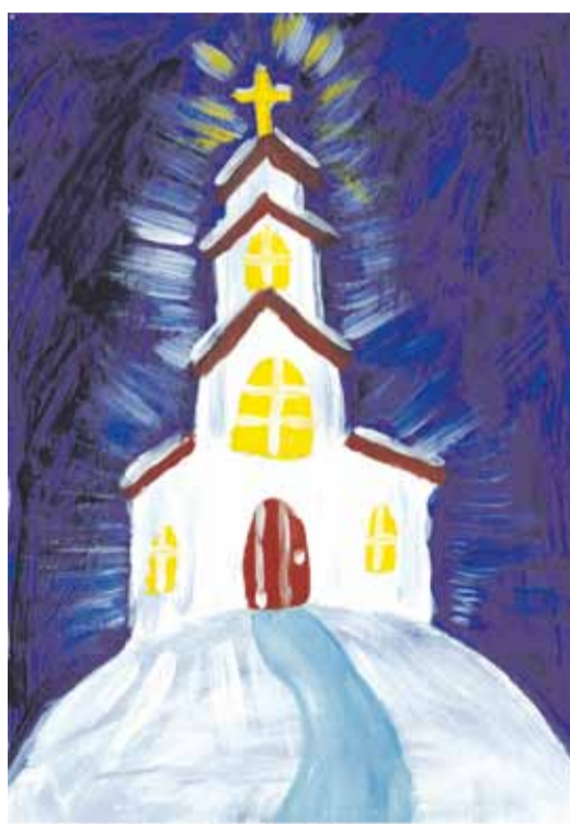
"Klusa nakts, svēta nakts" Markusa Valaiņa 7.a klase

Pēc konkursa nolikuma konkursantiem tika dots uzdevums uz A4 formāta lapas veidot vizuālās mākslas darbus jebkurā tehnikā – tas varēja būt zīmējums, gleznojums, grafika vai citā tehnikā veidots darbs. Konkursam tika iesniegti 20 darbi, no kuriem žūrijas komisija izvēlētās trīs labākos, kas tiks izmantoti svētku