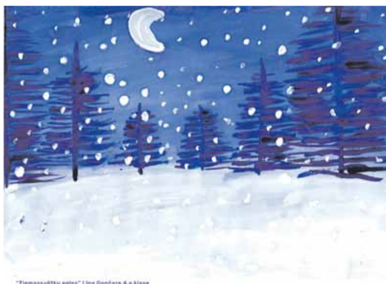
"Ziemassvētku egles" Līna Gončare 4.a klase

Markusa darbiņš tiks izmantots Ziemassvētku atklātnēm, kas tiks sūtītas pa e-pastu, Līnas zīmējums tiks izmantots svētku apsveikumam