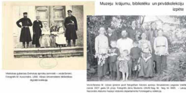
Izpētes darbs Latvijas Universitātes Latvijas vēstures institūta Etnogrāfisko materiālu krātuvē, 2023

Zīmīgi, ka liela daļa Dvinskas apriņķa iedzīvotāju 19. gs. beigās (ap 4500 zemnieku) smago dzīves apstākļu spiesti strādāja īslaicīgu, visbiežāk sezonālu darbu Krievijas impērijā ārpus savas pastāvīgās dzīvesvietas (kr.: отхожий промысел vai отходничество). Dvinskas apriņķī 1896. gadā bija vislielākais peļņā devušos cilvēku skaits visā Vitebskas guberņā, tādēļ no 19. gadsimta beigām arī pašā krievu zemnieku ģērbšanās stilā bija notikušas lielas izmaiņas. Šai posmā bija vērojama tendence atteikties no tradicionālā tautas tērpa un aizstāt to ar pilsētnieku apģērbu. To sekmēja arī Daugavpils pilsētas tuvums un turp pa Daugavu kursējošās baržas. Vietējā Slutišķu prece – meža veltes un zivis – tika mainītas pret rūpnieciski ražotiem audumiem un apģērbiem. Vecticībnieku sadzīvē pamazām ienāca pilsētas tipa piegriezuma apģērbs, kas pirmkārt nomainīja tradicionālo goda tērpu, bet pēc tam arī ikdienas drēbes.