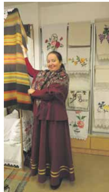
Projektā “Slutišķu ciema vecticībnieku kultūras mantojuma izziņāšana, atpazīstamības veicināšana un integrēšana muzeja izglītojošajās aktivitātēs” izgatavotais gida tērps, 2023

Senā tradicionālā krievu zemnieku apģērba nomainīja pret jauno, pilsētas tipa apģērbu bija aizsākusies līdz 20. gadsimta sākumam, taču šis process nebija vēl pilnīgi