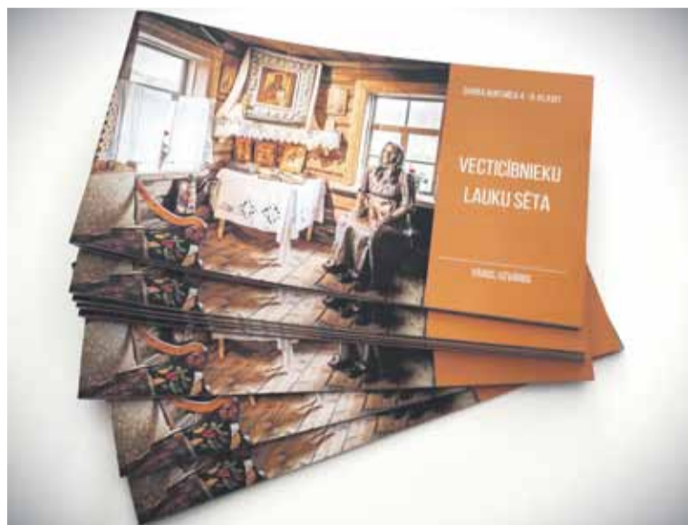
Projektā "Slutišķu ciema vecticībnieku kultūras mantojuma izzināšana, atpazīstamības veicināšana un integrēšana muzeja izglītojošajās aktivitātēs" izdotā darba burtnīca, 2023

Valsts kultūrkapitāla fonda mērķprogrammas "Latviešu vēsturisko zemju attīstības programma" projektu konkursa "Latgales kultūras programma 2023" ietvaros, Naujenes Novadpētniecības muzejā tika īstenots projekts "Slutišķu ciema vecticībnieku kultūras mantojuma izzināšana, atpazīstamības veicināšana un integrēšana muzeja izglītojošajās aktivitātēs". Projektā tika radīta izglītojošā programma skolēniem, kā arī pētīts vecticībnieku ikdienas