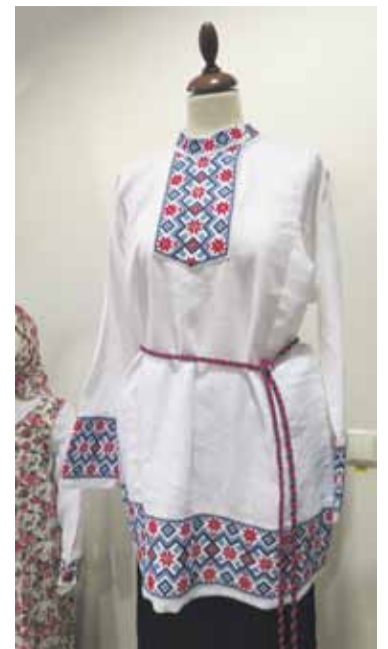
Izstādes vajadzībām izgatavotais vecticībnieku kreklis [kosovorotka] ar vīto jostu. Izšuvuma atdarinājums veikts pēc Augšdaugavas novada Skrudalienas pagasta Voitišķos saglabājušās parauga.

pabeigts. Līdztekus pilsētas fasona drānām, gadsimtu gaitā izveidojušos zemniecisko paradumu un gaumes noturīguma dēļ, turpināja pastāvēt atsevišķi senā apģērba veidi, kaut arī tos jau šuva no pirkta auduma. Šajā laika posmā vislabāk saglabājās ar reliģiskajiem rituāliem saistītais apģērbs.