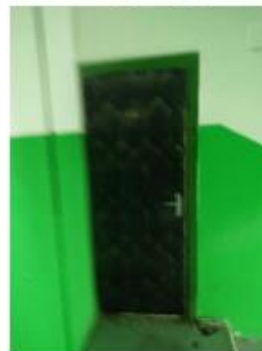
6.attēls. Dzīvokļa ārdurvis