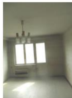
9.,10.,11.attēls. Dzīvojamā istaba (telpa Nr. 2)