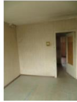
15.,16.,17.attēls. Dzīvojamā istaba (telpa Nr. 3)