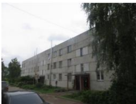
1.attēls. Dzīvojamā māja un apkārtnē