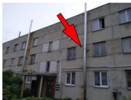
2.attēls. Dzīvokļa atrašanās vieta ēkā