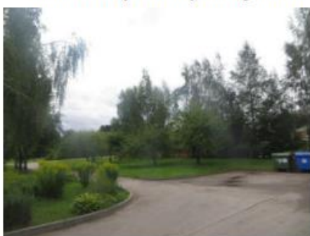
3.attēls. Dzīvokļa atrašanās vieta ēkā