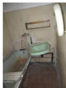
26.,27.,28.attēls. Vannas istaba