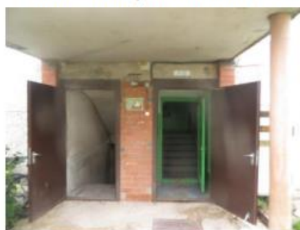
4.attēls. Ieeja kāpņu telpā