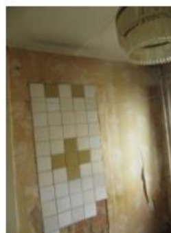
12.,13.,14.attēls. Dzīvojamā istaba (telpa Nr. 1)