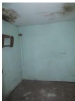
6.attēls. Pieliekamais (telpa Nr. 5)