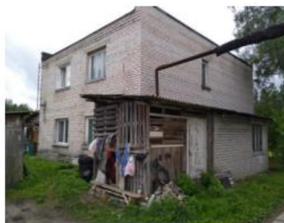
2.attēls. Dzīvojamā māja un apkārtnē