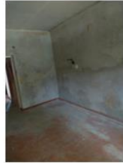
9.,10.,11.attēls. Dzīvojamā istaba (telpa Nr. 1)