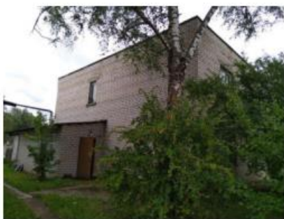
1.attēls. Dzīvojamā māja un apkārtnē