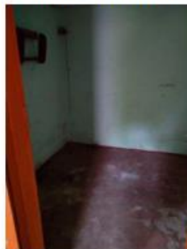
7.,8.attēls. Pieliekamais (telpa Nr. 5)