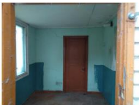
5.attēls. Koridors (telpa Nr. 6)