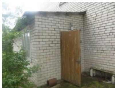
4.attēls. Dzīvojamā māja un apkārtnē