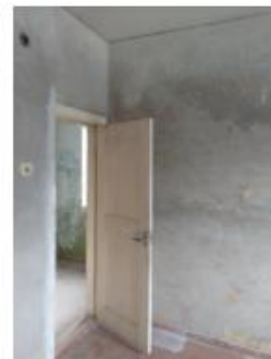
15.,16.,17.attēls. Dzīvojamā istaba (telpa Nr. 7)