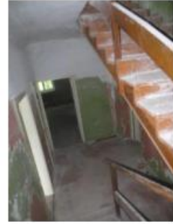
21.,22.,23.attēls. Kāpņu telpa 1. stāvā