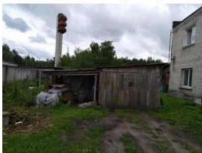
3.attēls. Dzīvojamā māja un apkārtnē