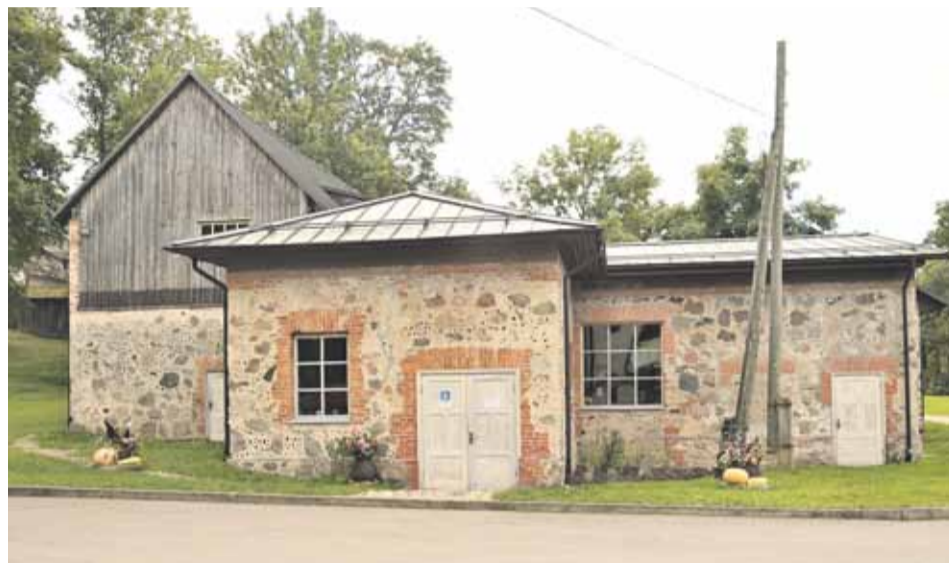
Ceturto Sēlijas tūrisma tirgu rīko kopienu sadarbības tīkls "Sēlijas salas", Bebrene pagasta Tūrisma informācijas punkts un Bebrene pagasta pārvalde sadarbībā ar Sēlijas pašvaldību tūrisma informācijas centriem, Sēlijas tūrisma pakalpojumu sniedzējiem un kopienām.

Informāciju sagatavoja: Jānis Dzimitāis, kopienu sadarbības tīkla "Sēlijas salas" sabiedrisko attiecību un tūrisma speciālists