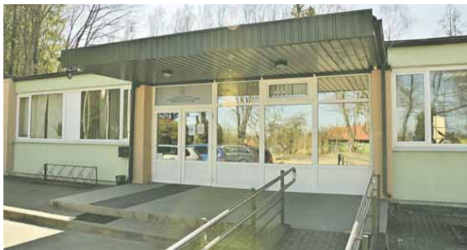
VPVKAC Špoģos, Skolas ielā 17