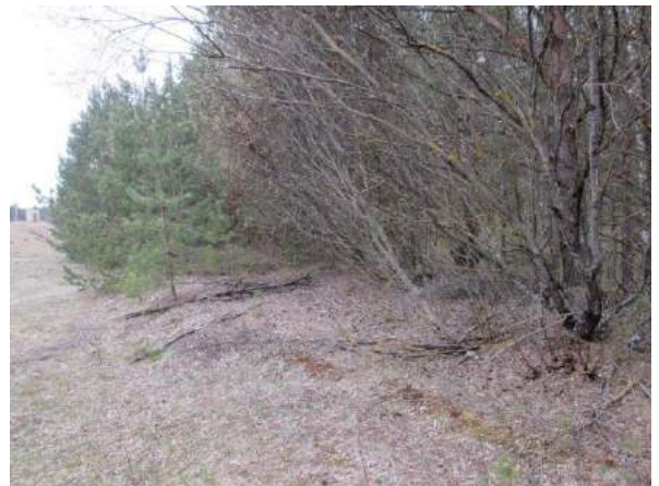
5.attēls - apaugums dzelzceļa nodalījuma joslā