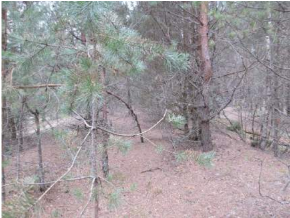
6.attēls - apaugums dzelzceļa nodalījuma joslā