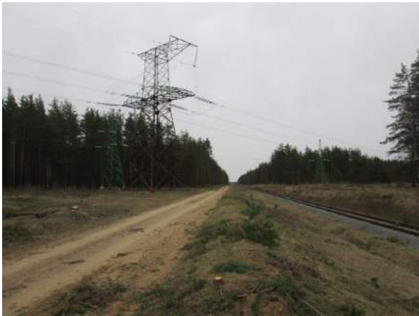
8.-9.attēls - esošā transporta infrastruktūra