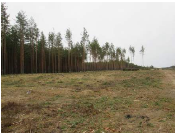
10.-13.attēls - dabīgais apaugums dzelzceļa zemes nodalījuma joslā