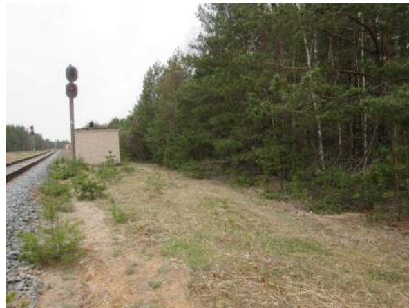
4.attēls – būves dzelzceļa nodalījuma joslā