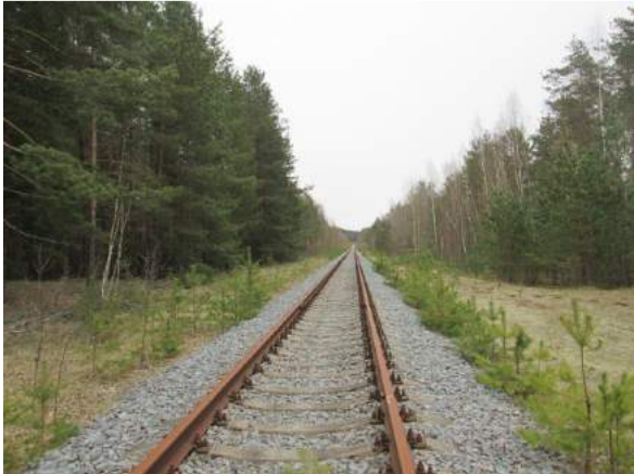
2.-3.attēls - savienojošais sliežu ceļš (apvedceļš)