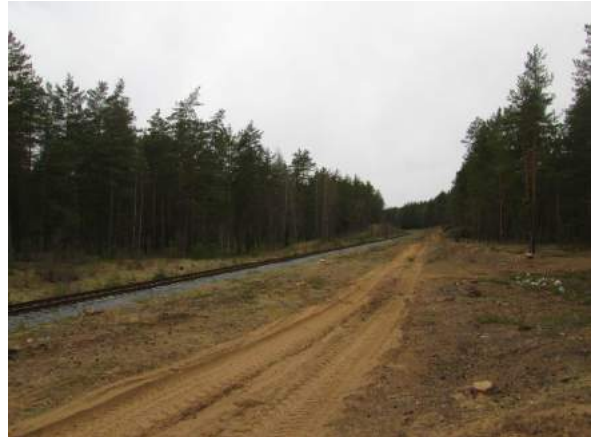
7.attēls - piebraucamais ceļš